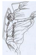
Entre le matelas et la barrière